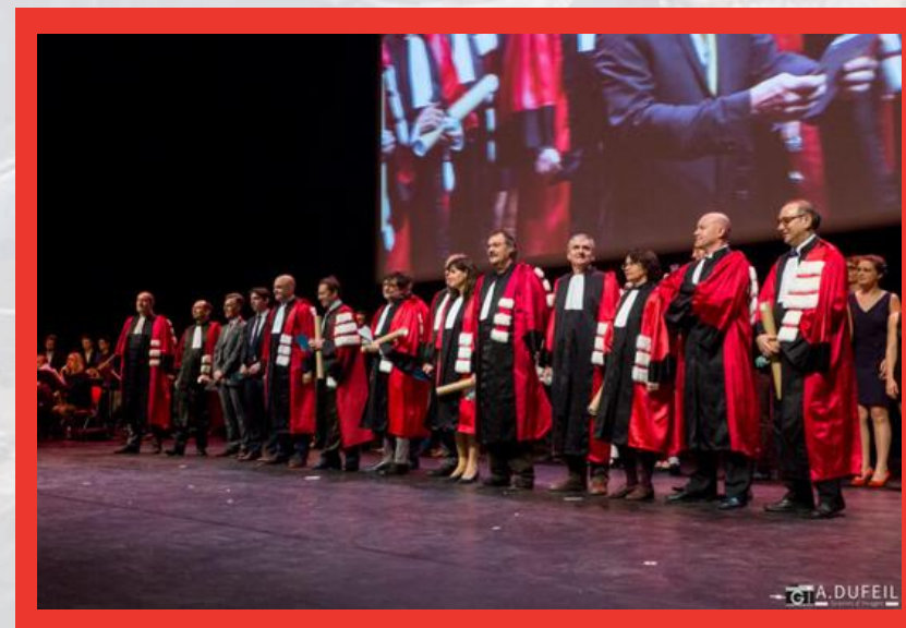
Ceremonia de Graduación