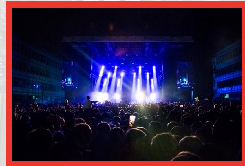
24H del INSA